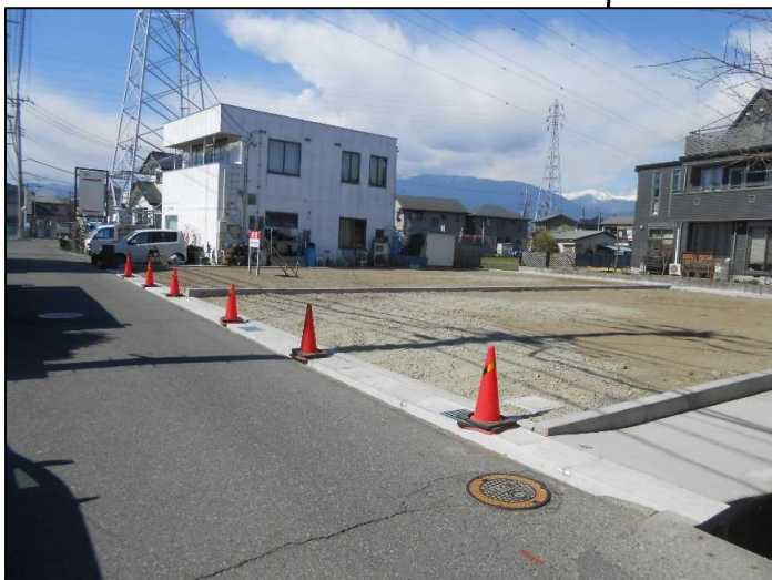
※図面と現況が相違する場合は、現況を優先とします。